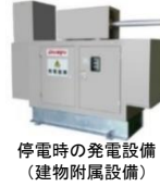
(中小企業経営強化税制の強化イメージ)