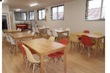
休憩室や食堂等の整備に係る建物附属設備等が対象に